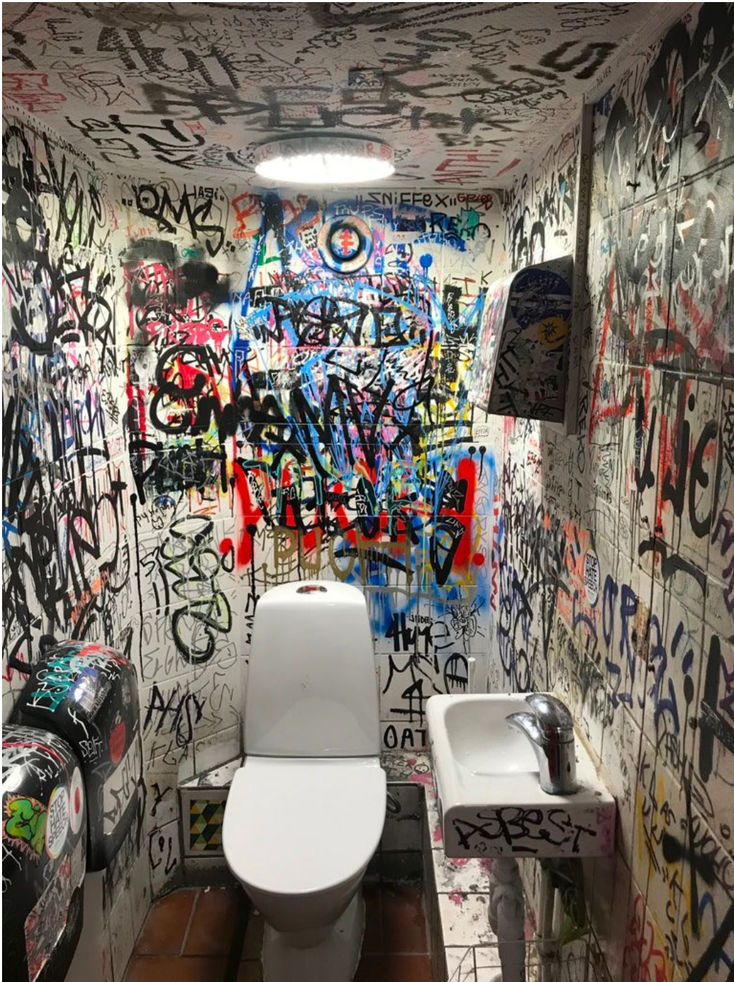
(Pubtoalett, Andra Långgatan, 18 feb 2020)